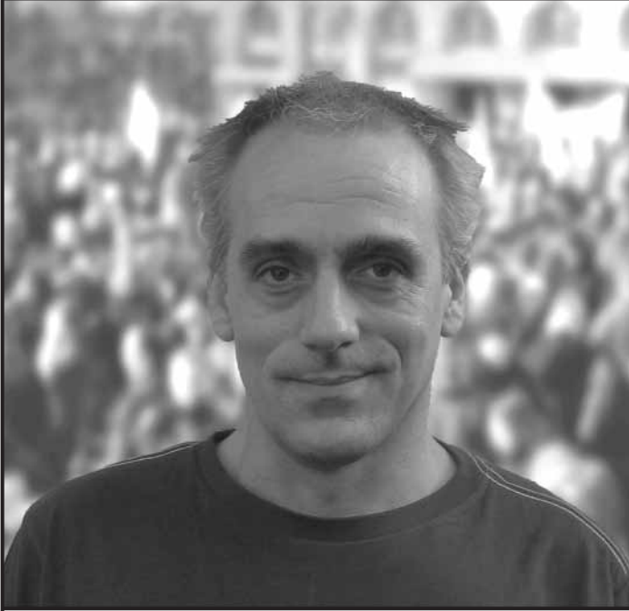
Tête de liste Régionale