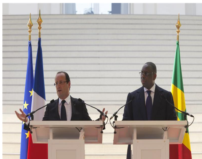
Hollande et son homologue sénégalais Macky Sall

Lorsque Hollande le social démocrate arrive au pouvoir le 6 mars 2012 en battant Sarkozy, les dés étaient déjà jetés. La crise libyenne n'était pas encore finie. Les dégâts collatéraux de la libération du pays (grâce au meurtre de Kadhafi) vont s'avérer pire que la guerre pour le chasser puisqu'ils toucheront d'autres pays comme le Mali.