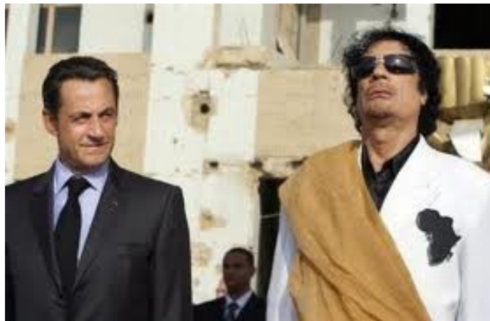
Sarkozy et Kadhafi lorsqu'ils étaient « amis »

La France de Sarkozy a été, de 2007 à 2012, une France décomplexée. Dans l'intérêt de la France, tout a été bon, sans aucune pensée aux conséquences. Il fallait coûte que coûte que la France rayonne.