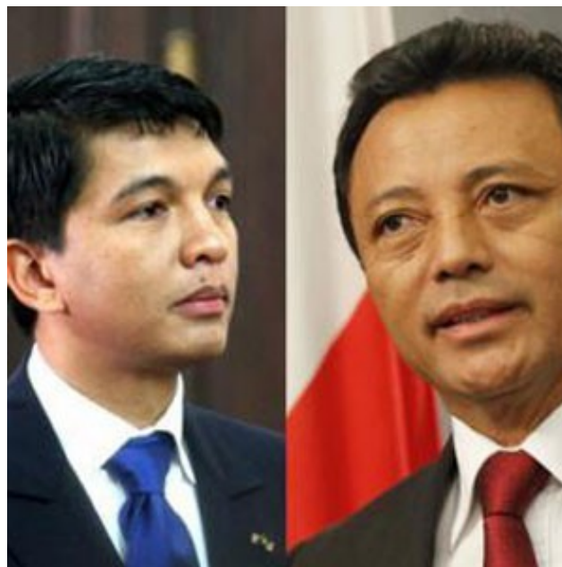
Rajoelina et Ravalomanana

Mais y aura-t-il seulement élections ? Les mises en œuvre actuelles de stratégies et de tactiques encore plus cyniques par les belligérants politico-affairistes extérieurs et intérieurs du chaos malgache ne sont probablement pas de bon augure pour les 21 millions de Malgaches en quête de sérénité et d'un peu de mieux-être... Mais la majorité de la population n'est pas dupe des enjeux du micmac politicien-affairiste ambiant. Multinationales et puissances anciennes et/ou émergentes, alliées à leurs clientèles locales respectives, rivalisent.