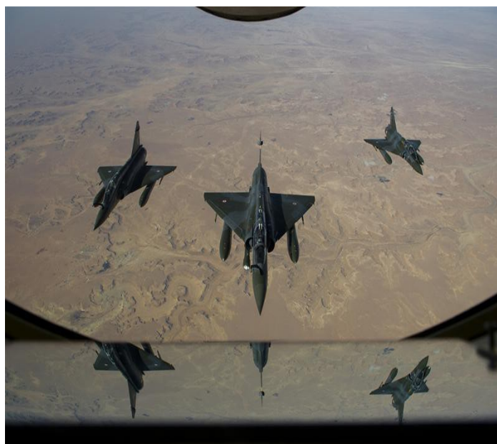
Mirage au Mali

Bien que cela ne soit pas déterminant, l'épisode reste néanmoins révélateur de l'ingérence française au Mali ; en effet pendant des mois la CEDEAO a bloqué les armes pourtant régulièrement achetées par le Mali., ces dernières ne furent libérées trois jours après que Dioncounda Traoré ait demandé officiellement l'envoi d'une force militaire étrangère au Conseil de Sécurité de l'ONU.