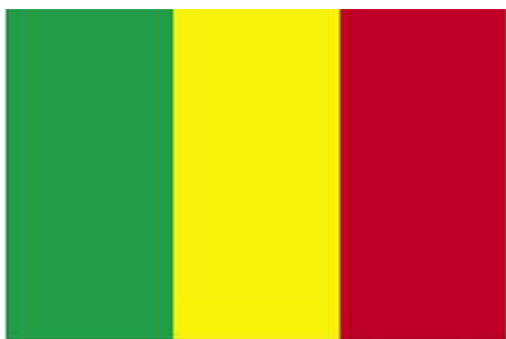
Drapeau du mali

De fortes présomptions existent quant à l'utilisation par l'armée française de « munitions flèches ». Ces munitions dotées à leur extrémité d'uranium appauvri qui a un double « avantage » : il augmente la puissance de perforation et son coût est bien moindre que le tungstène qui est aussi utilisé.