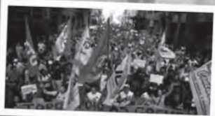
BRÉSIL UNE NOUVELLE PÉRIODE DANS LA LUTTE DES CLASSES