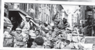
IL Y A QUARANTE ANS, LE MOUVEMENTS DES SOLDATS