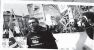
RETOUR DU SIXIÈME CONGRÈS DE SOLIDAIRES